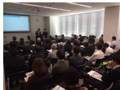
MIJS働き方改革事例セミナー